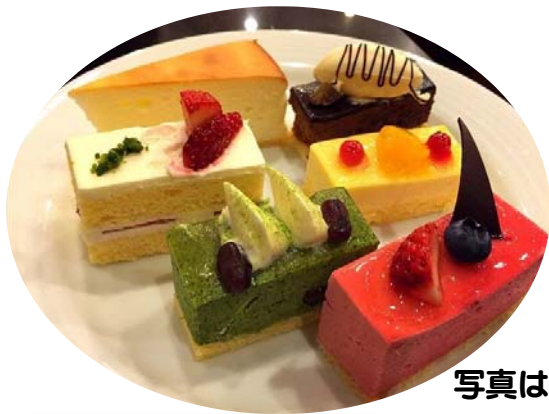
写真は、イメージです。