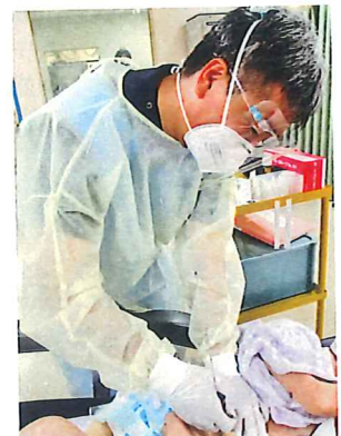
安全性に配慮し 胃ろうカテーテル交換を実施