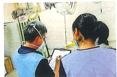
情報収集も大切な役割です

胃ろうカテーテル交換を安全に実施できたときです。待たせることなく実施できるようになり、胃ろうからの漏れや皮膚トラブルの対処方法などを家族や施設職員へ指導する時間も確保することができました。